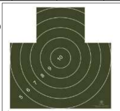
Alalisa1.3 Ülesandmisleht Koloneli laskmine juhendi juurde